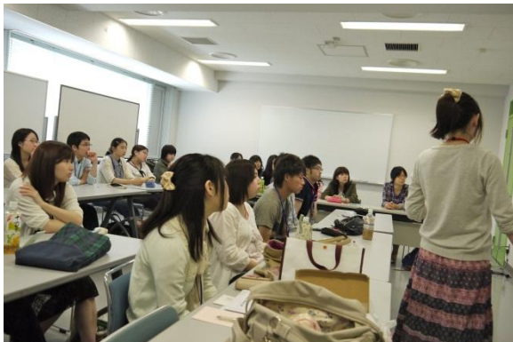
聞き入る皆の様子